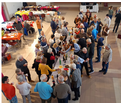
Tradition et partage pour l'omelette pascal