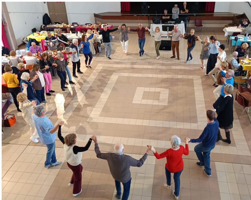
Une belle ronde