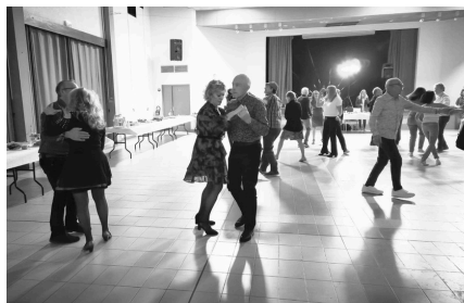
Stardances - Une soirée réussie