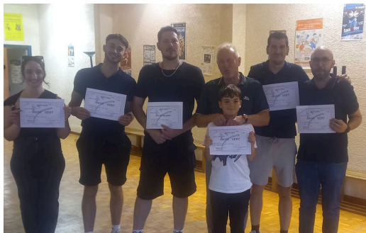
Boxe Française - Bon palmarès pour la jeunesse