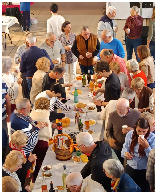
Un apéritif convivial

Puis ce fût au tour des Sardanistes de la Raho de partager de belles sardanes traditionnelles avec le public ; l'auberge espagnole a ensuite réuni l'assemblée autour de mets variés que chacun s'échangeait, accompagnés par une musique entrainante programmée par un DJ dynamique, sachant créer une ambiance conviviale et festive qui restera longtemps dans le souvenir des participants.