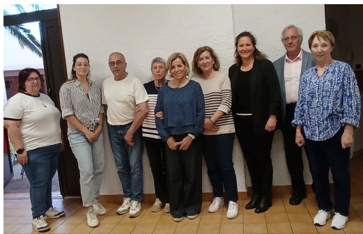
Assemblée Générale du Don du Sang - Nouveau Bureau