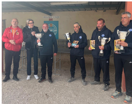
Jeu provençal - Villeneuve au sommet