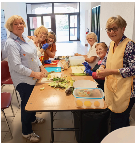
Préparation des ingrédients

C'est à la salle des fêtes Paulin Gourbal que se sont réunis le lundi 6 avril dernier de nombreux habitants, afin de partager la traditionnelle omelette préparée dès le matin par des élus et des bénévoles du « Foyer de la Raho ».