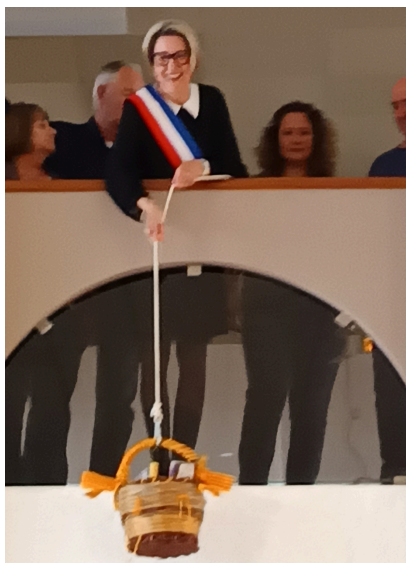
Descente de la "Cistella"