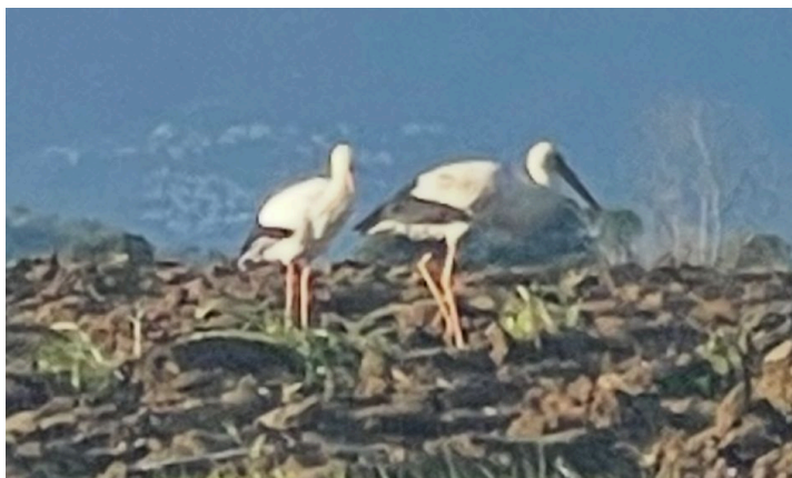
Arrivée des cigognes sur la commune

Villeneuve-de-la-Raho infos - Magazine de la commune.