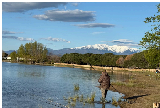
Concours de pêche - La plus grosse truite pêchée